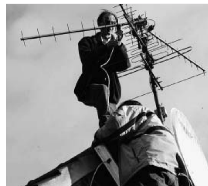
Pour recevoir la TNT, il sera peut-être nécessaire de réorienter votre antenne vers le bon émetteur.

► D'ici la fin de l'année, la région sera couverte à plus de 98 %. Mais des zones, bien identifiées, demeureront mal ou pas du tout desservies. Parmi celles-ci, dans le Pas-de-Calais : Ouve-Wirquin, Merck-Saint-Liévin, Sempy, Montcaveil, Marconne, Fillièvres, Saint-Pol-sur-Ternoise, Frévent, Auxi-le-Château. Dans le Nord : Cousolre, Fournies, Avesnes-sur-Helpe.