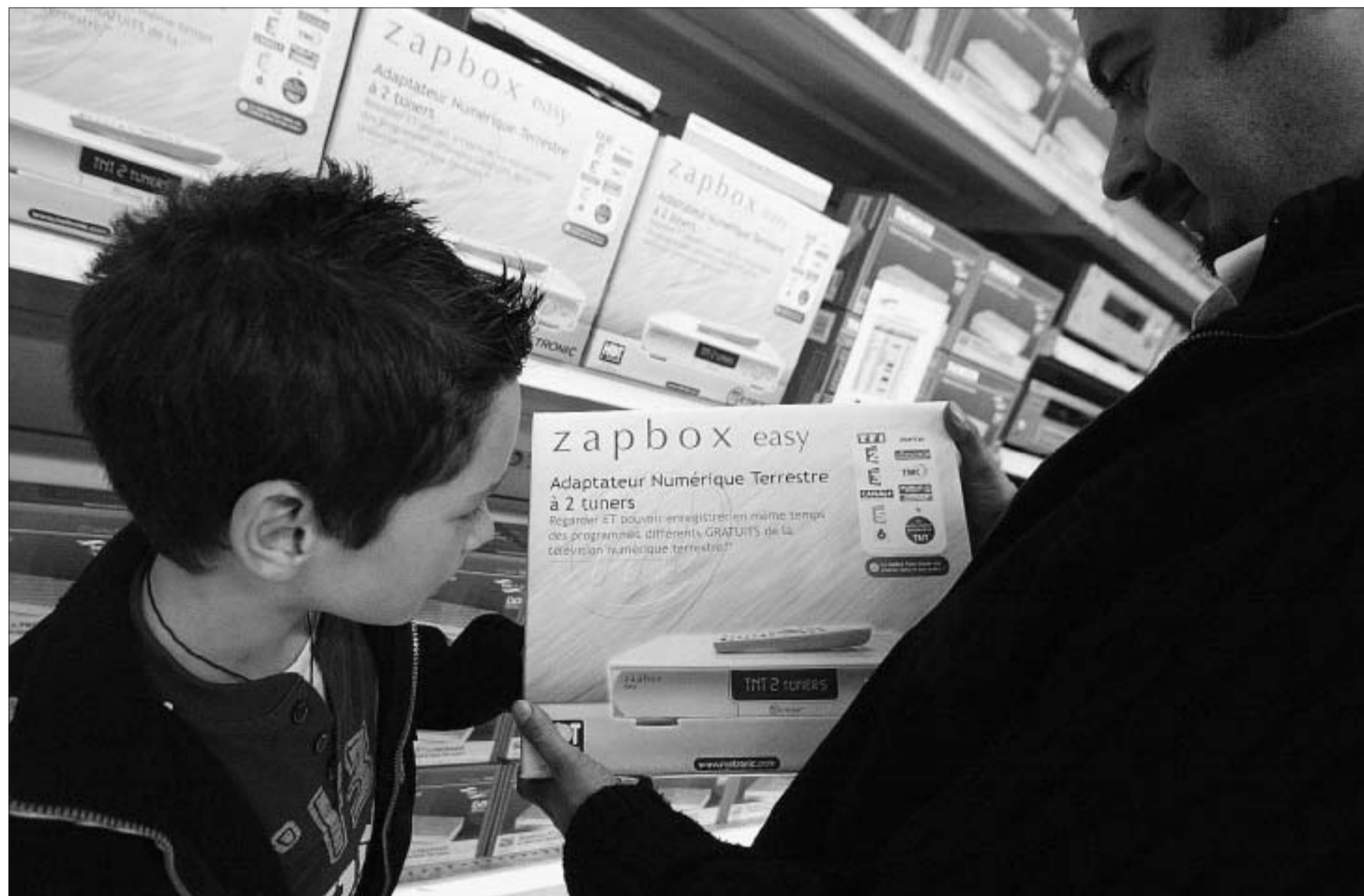
Avant l'achat d'un adaptateur, le téléspectateur doit s'assurer

Une fois les derniers émetteurs installés dans la région ou à proximité, certains téléspectateurs resteront privés d'accès à la TNT. S'ils habitent une zone enclavée, une cuvette, par exemple. Pour ces secteurs, le CSA envisage le déploiement d'un réseau complémentaire. En clair, de petits émetteurs seront implantés sur le territoire pour assurer une meilleure couverture. Mais, d'ici la fin de l'année, le Nord - Pas-de-Calais figurera parmi les régions les mieux couvertes, avec plus de 98 %. Alors que d'autres départements n'atteignent pas encore les 50 %. Nous ne serons donc pas prioritaires. Surtout s'il s'agit de micro-territoires. La seule solution pour le particulier aujourd'hui : s'équiper d'une réception satellite.