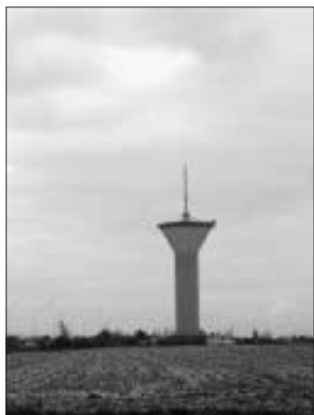
L'émetteur est installé sur un pylône de 65 m de haut.

► Quelles chaînes allez-vous recevoir ? Tout d'abord les chaînes hertziennes que vous receviez déjà : TF1, France 2, France 3, Canal + (en clair), Arte et France 5 (l'une et l'autre en continu toute la journée) et M6. Viennent s'ajouter France 4, Direct 8, W9, NT1, TMC, NRJ12, LCP (La Chaîne parlementaire), iTélé et BFM TV (deux chaînes d'information en continu), Europe2 et