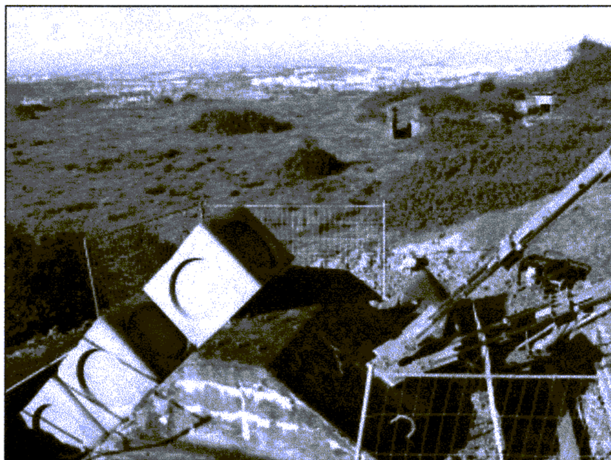
Pour renforcer la stabilité de l'émetteur radio-télé du Mont Lambert, des ouvriers coulent du béton à la base des six haubans.

La date officielle n'est pas encore connue, mais tout sera prêt techniquement pour que le Boulonnais et une bonne partie du Calaisis reçoivent les nouvelles chaînes numériques avant Noël.